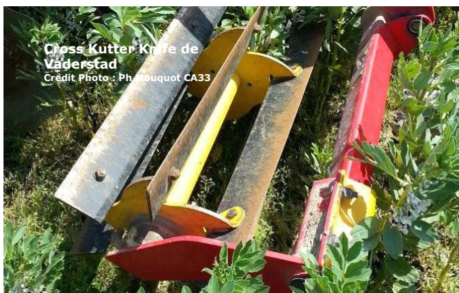
Cross Kutter Knife de Väderstad