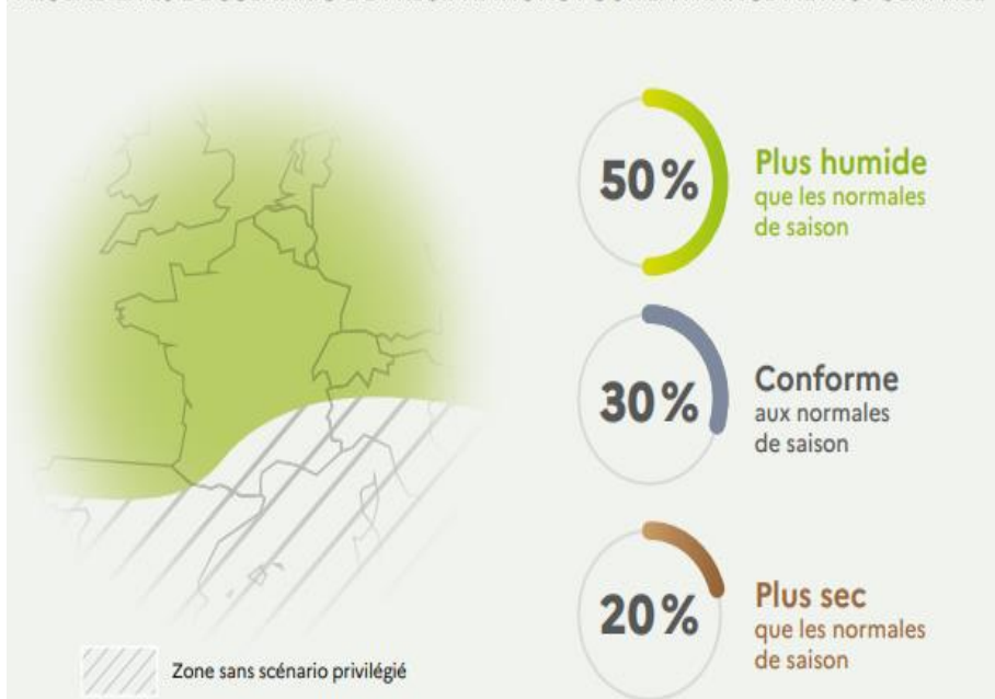
Figure 2 : Tendence à trois mois pour les précipitations